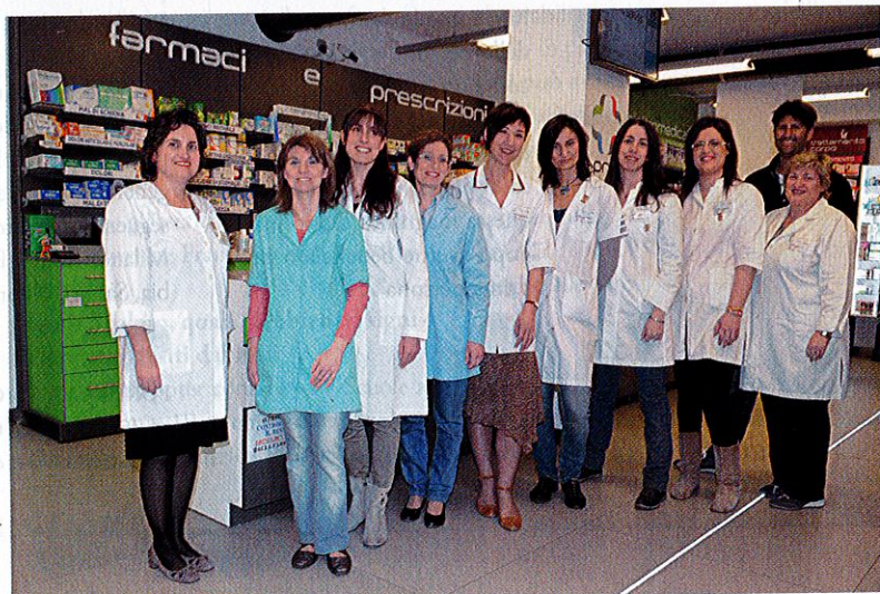
LO STAFF DELLA FARMACIA PRETI

Di recente la struttura si è completamente rinnovata. Alla consueta attenzione, competenza professionale e gentilezza del personale della farmacia, si è aggiunta un'organizzazione più funzionale dei reparti e maggior esposizione, il tutto in un ambiente accogliente ed elegante. Per aumentare la qualità del lavoro e l'attenzione verso il cliente, è stato scelto il sistema Rowa di stoccaggio dei farmaci. "Era necessario gestire numerose referenze al meglio e senza sprechi, evitando - spiegano le titolari - scadenze e spese inutili. Con il sistema Rowa si ottiene una gestione oculata di farmaci ad alta e bassa rotazione, poco spazio occupato unito all'effettiva semplicità di utilizzo. Risultato: 30.000 referenze e la possibilità di incrementare il tempo dedicato al cliente. Una volta selezionata sulla tastiera la richiesta, il farmacista - tramite gestionale - attiva l'operazione dell'invio farmaco al robot che arriva nel punto di consegna".